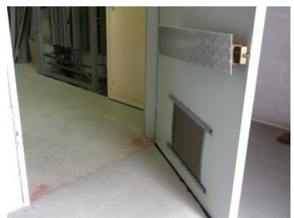
BROSSOL®-Rod fixée au bas des portes