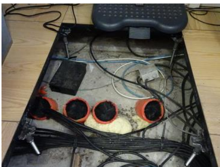
Mit BROSSOL® geschützte Kabel in Rohrleitungen