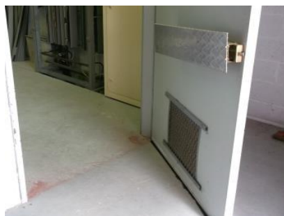
BROSSOL®-ROD an der Türunterkante