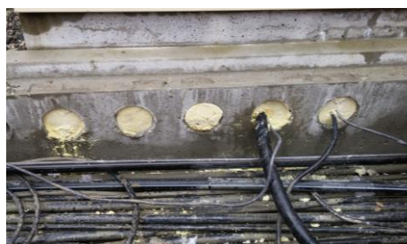
Rohreingang mit COVERSOL® versiegelt