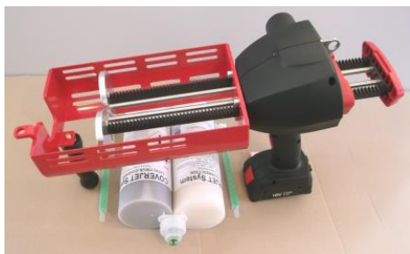
COVERJET® System: Spritzpistole und Kartusche